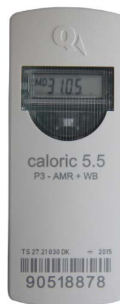
Q caloric 5.5 P3

Producent og ansøger: Qundis GmbH, Sonnentor 2, 99098 Erfurt, Tyskland