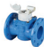
WPD / WPHD / WSD