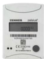
Zelsius® C5 ISF / Zelsius® C5 IUF