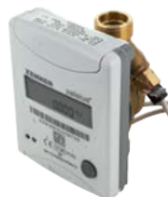
Zelsius® C5 ISF / Zelsius® C5 IUF