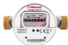
APZ Minomess Radio 5