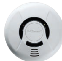
Minoprotect® 3 / Minoprotect® 4